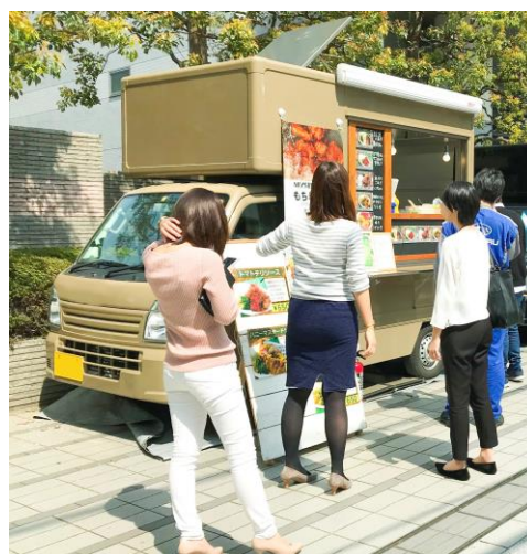
フードトラック イメージ